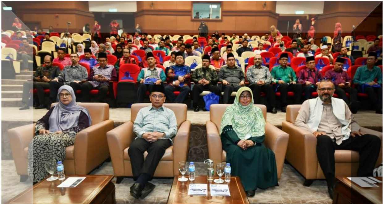
PERSIDANGAN EKSEKUTIF MINDA MAQASID 24 Julai 2023 Dewan Auditorium Ibnu Sina, Masjid Putra, Putrajaya

Persidangan ini telah disempurnakan oleh YB Senator Dato' Setia Dr. Haji Mohd Na'im bin Haji Mokhtar, Menteri di Jabatan Perdana Menteri (Hal Ehwal Agama). Program ini merupakan salah satu langkah awal dalam menyambut saranan YAB Dato' Seri Anwar bin Ibrahim, Perdana Menteri untuk memperkasa dan memperluas peranan jabatan ini merentasi pelbagai bidang.