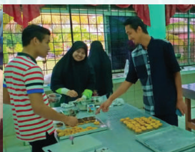
Bengkel Pemprosesan Makanan