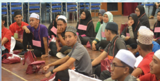
29 April - 3 Mei 2019 - Minggu Taaruf Pelajar IKMAS (MALPI)