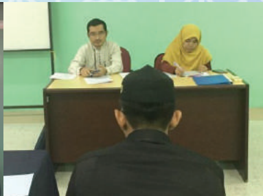
8-14 April 2019 - Sesi temuduga kemasukan pelajar baharu bagi tahun 2019/2022 IKMAS