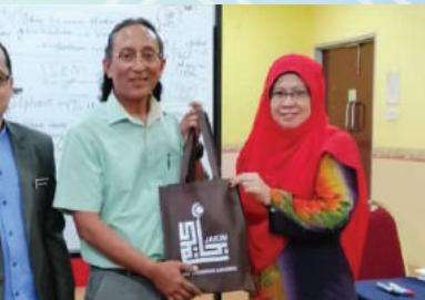
9 - 11 April 2019 - Bengkel Semakan Kurikulum Diploma Dakwah Islamiyyah Ikmas dan IPDAS bagi MQA O2.