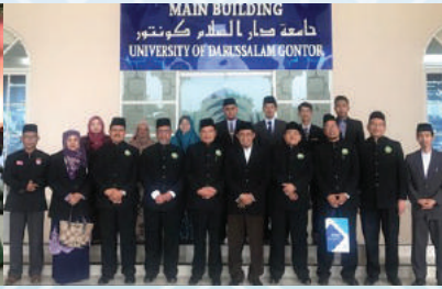
5 April 2019 - Lawatan YBhg. Pengarah IKMAS ke Universiti Darussalam, Gontor, Kabupaten Ponorogo, Jawa Tengah.