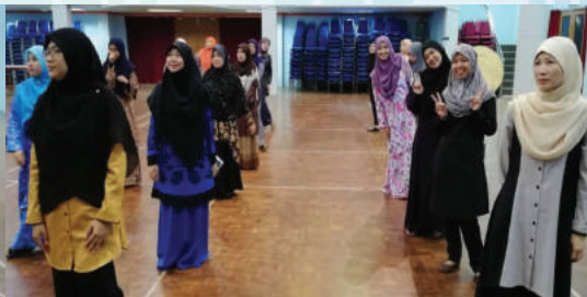
16 April 2019 - Sesi senaman ringan "JOM FIT" warga IKMAS .