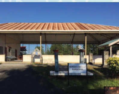
Bengkel Binaan Bangunan

Kewujudan Institut Kemahiran Islam Malaysia Sarawak amatlah bersesuaian dengan saranan kerajaan Malaysia supaya perkembangan masyarakat Islam di Borneo terutamanya Sarawak dititikberatkan. Memiliki program Diploma Dakwah Islamiyyah dan Diploma Tahfiz al-Quran dan al-Qiraat yang diiktiraf MQA, IKMAS akan sentiasa terus melahirkan modal insan agar dapat menyumbang khidmat dan bakti dalam pelbagai lapangan tugas dan pekerjaan. Melihat kepada prasarana yang dimiliki oleh IKMAS merelevankan sebagai sebuah institusi pengajian Islam yang unggul di bumi Kenyalang.