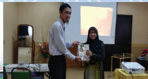
17 April 2019 - Bengkel Pembelajaran dan Pengajaran kepada para pensyarah demi meningkatkan mutu akademik IKMAS.