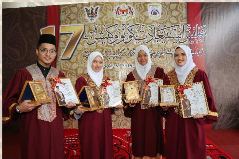
Penerima anugerah sempena Majlis Istiadat Konvokesyen IKMAS Kali Ke-17

Kini, Alumni IKMAS telah menyumbang khidmat dan bakti dalam pelbagai lapangan tugas dan pekerjaan. Hal ini membuktikan bahawa keluaran IKMAS turut membantu dalam merencanakan lagi usaha dakwah di Bumi Kenyalang. Semoga IKMAS akan terus melahirkan modal insan berkemahiran serta mampu menjadi pendakwah yang berketrampilan dan berwibawa.