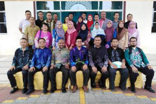
16 - 18 Julai - Kursus Pengurusan Stress