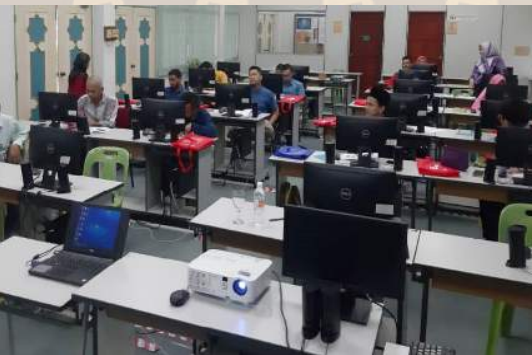
28 - 29 Ogos - Kursus Komunikasi Dakwah Baru