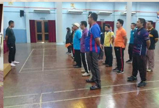
27 September - Latihan Perbarisan Kakitangan IKMAS Sempena Rapat Raksasa Hari Jadi Tuan Yang Terutama Negeri Sarawak Kali Ke 83