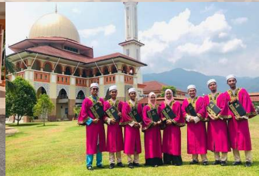
27 Julai - 8 Orang Pelajar Diploma Tahfiz al-Quran dan al-Qiraat IKMAS Berjaya Mendapat Segulung Diploma Pada Majlis Istiadat Konvokesyen Darul Quran Kali Ke-28