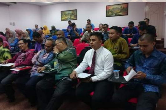
6 September - Bicara Integriti IKMAS: kerjasama IKMAS dan Unit Integriti Jabatan Perdana Menteri