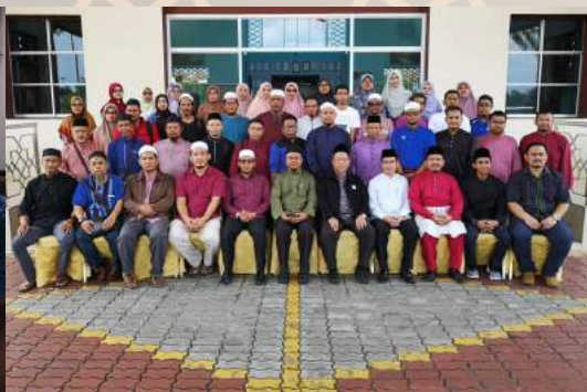
27 September - Lawatan Rombongan Pejabat Qadi Daerah Batu Pahat Johor