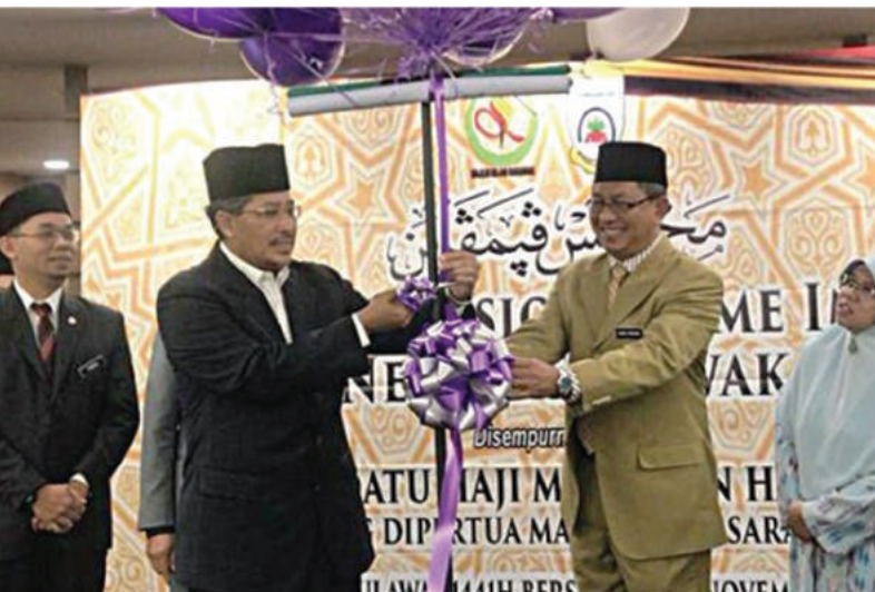
PELANCARAN PORTAL MYIKMAS