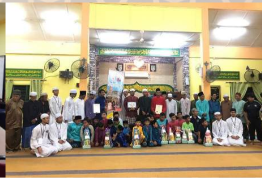
2 - 25 Ogos - Program Khidmat Masyarakat Pelajar Semester 5 DTQ