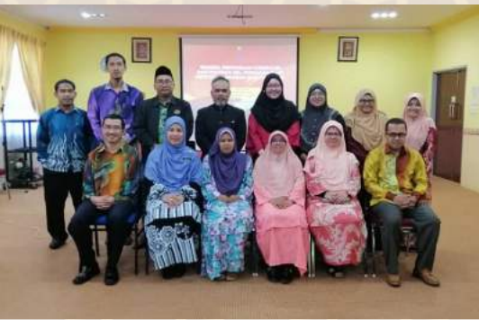
21 - 23 Ogos - Bengkel Penggubalan Kurikulum bagi Program Persijilan Islam oleh Bahagian JJK dan BDKI