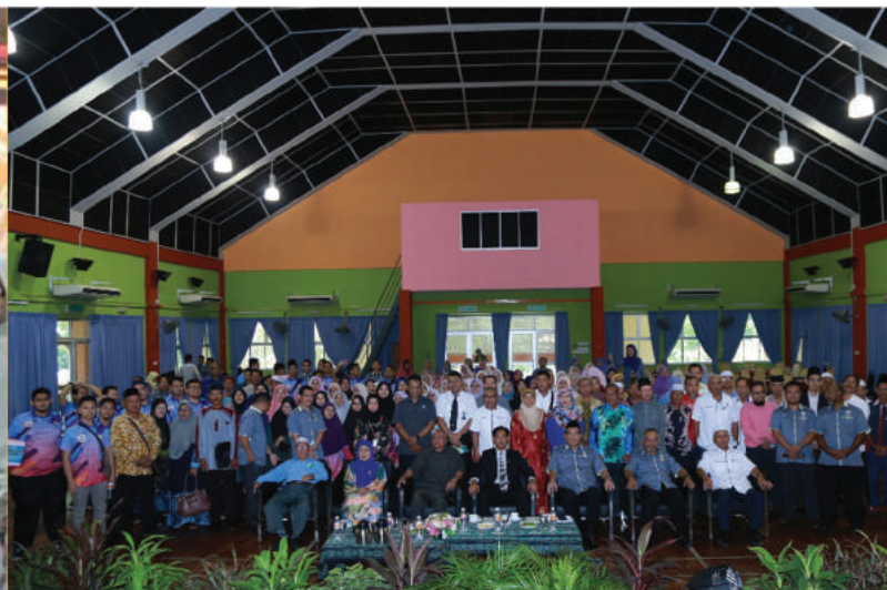
PROGRAM MENYEMAI BAKTI IKMAS 2019