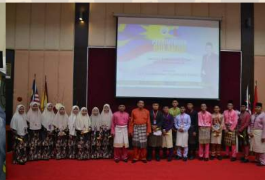
30 Ogos - Perhimpunan Bulanan IKMAS Ogos 2019