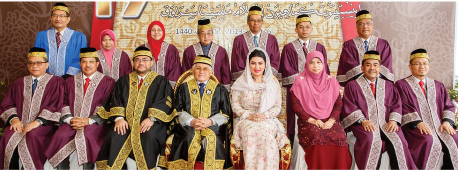
AHLI LEMBAGA: PENERAJU TRANSFORMASI IKMAS