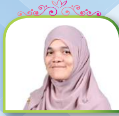
THAILAND KARIMAH HAYIBARAHENG