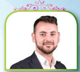
GERMANY ABDULKERIM ILERI