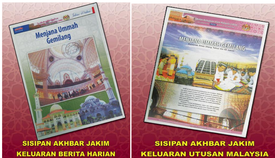
Sisipan akhbar yang diterbitkan sempena 40 Tahun Jakim pada tahun 2008

34. Penerbitan sisipan Jakim di akhbar dimulakan pada tahun 2007 bertujuan memberi maklumat mengenai pencapaian dan kejayaan yang dicapai oleh Jakim dalam beberapa perkara, iaitu mengurus dan mentadbir perkembangan kemajuan Islam di Malaysia, memperkenalkan Islam melalui media akhbar, menyalurkan maklumat Islam terkini dengan padat dan berkesan, dan memartabatkan Islam sebagai agama rasmi negara Malaysia.