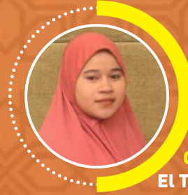
CAMBODIA El Torniyas