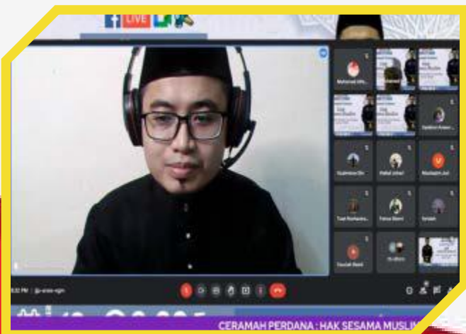
Ceramah Perdana: "Hak Sesama Muslim"