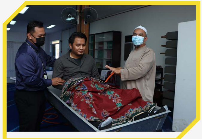
Sijil Profesionalisme Imam Negeri Sarawak 2021