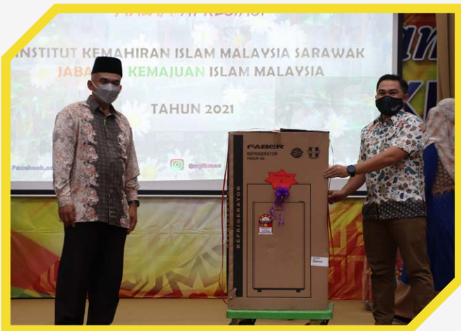
Malam Apresiasi IKMAS