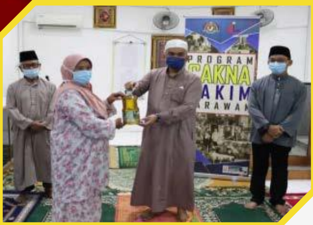
Program Cakna JAKIM Sarawak