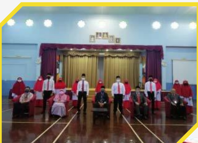
Minggu Aluan Pelajar (MALPI) IKMAS