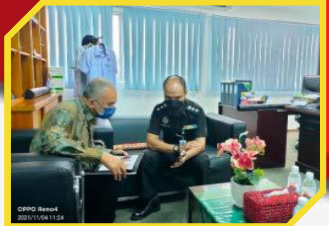
Perjumpaan serta Perbincangan Pengarah IKMAS dan Pengarah Penjara Puncak Borneo Kuching, Sarawak