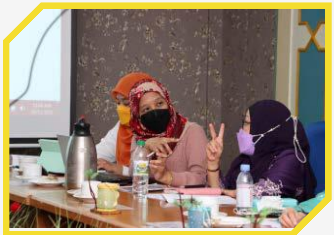
Perbincangan dan Pemurnian Dokumen MoU IKMAS - CENTEXS