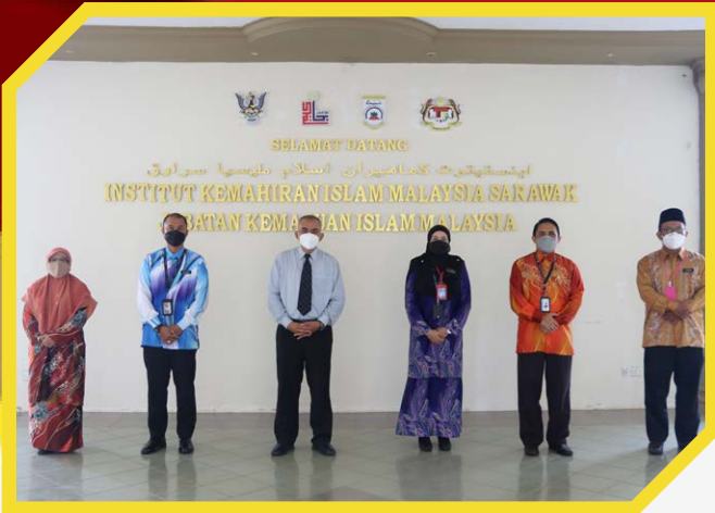
Kunjung Hormat Kementerian Dalam Negeri ke IKMAS