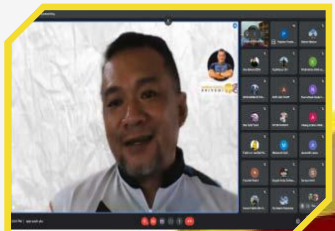
Ceramah Perkongsian Gaya Hidup Sihat: "Pemakanan Sihat"